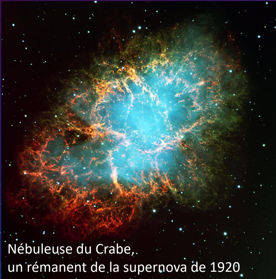
Nébuleuse du Crabe, un rémanent de la supernova de 1920