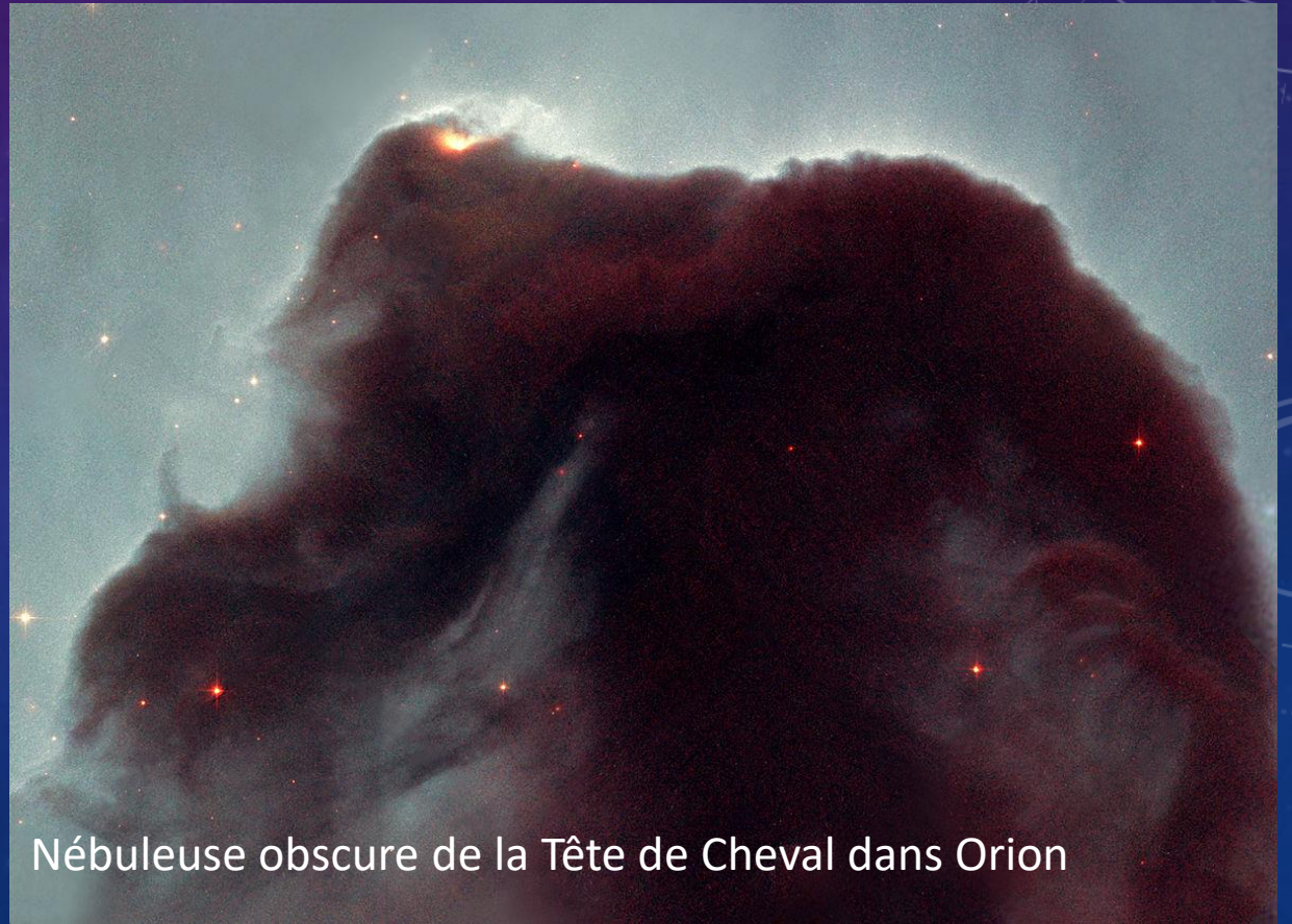
Nébuleuse obscure de la Tête de Cheval dans Orion